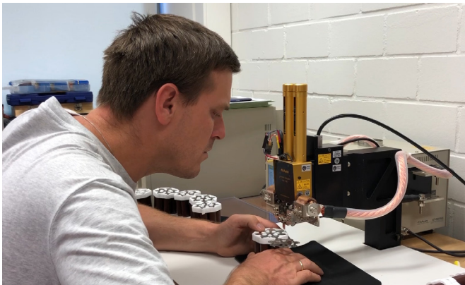
Widerstandspunktschweißen der Li-Ionen Zellen im Fraunhofer LBF

Batteriemanagement, -integration und -kühlung sind die entscheidenden Qualitätsmerkmale eines fortschrittlichen Energiespeichersystems: Mit der TES-Technologie haben die Forscher aus der Fachgruppe »Systemzuverlässigkeit | Future Mobility« ein System konzipiert, das gegenüber marktüblichen Energiespeichern deutliche Vorteile hinsichtlich Kosten und Skalierbarkeit sowie Sicherheit und Zuverlässigkeit bietet. Die TES-Technologie kombiniert die Kostenvorteile und Robustheit zylindrischer Einzelzellen mit einem besonders hohen Maß der Funktionsintegration und Energieeffizienz. Mit der möglichen Standardisierung des tubular energy system (TES) hinsichtlich seiner Hauptabmessungen sind gute Voraussetzungen geschaffen, auch in sehr preissensitiven Anwendungen ein entsprechendes Marktpotenzial zu finden.